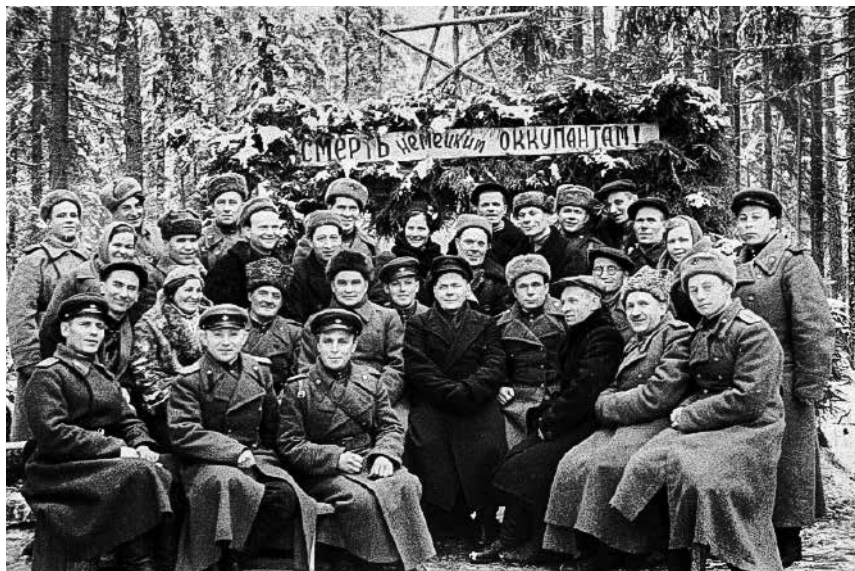
Офицеры 248-го ОГМД [4]

корпуса. Учащиеся 7А класса откликнулись. Они создали поисковый отряд «Память», который активно включился в эту работу.