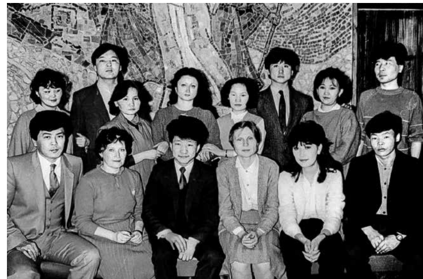
Собрание в красном уголке общежития

гих институтов. Жили они чаще всего по 4 человека. Была тенденция селить в общежитие в комнаты и монгольских, и советских студентов, чтобы они ощущали русский язык и общение с нашими советскими студентами. Гости монгольских студентов засиживались допоздна и потом были уже нарекания на нарушение порядка в общежитии. Что было, то было. Скрывать этого не будем, другое дело, что это требовало большого внимания с нашей стороны. И со стороны ректората, и со стороны деканата, и со стороны преподавателей по специальности... Раз в месяц мы проводили в общежитии в красном уголке, который сами оборудовали, собрания, на которых обязательно присутствовал третий секретарь посольства Монголии, присутствовали иногда заведующие кафедрами, в зависимости от того, какой вопрос мы ставили. Чаще всего это были учебные, творческие дела. Как правило, доставалось тем, кто недостаточно внимателен был, недостаточно прилежен был в занятиях, поэтому на этих собраниях, естественно, шел довольно строгий разговор. Ставились определенные цели и задачи, когда надо было разрешить все сложности учебного процесса. Но самое главное,