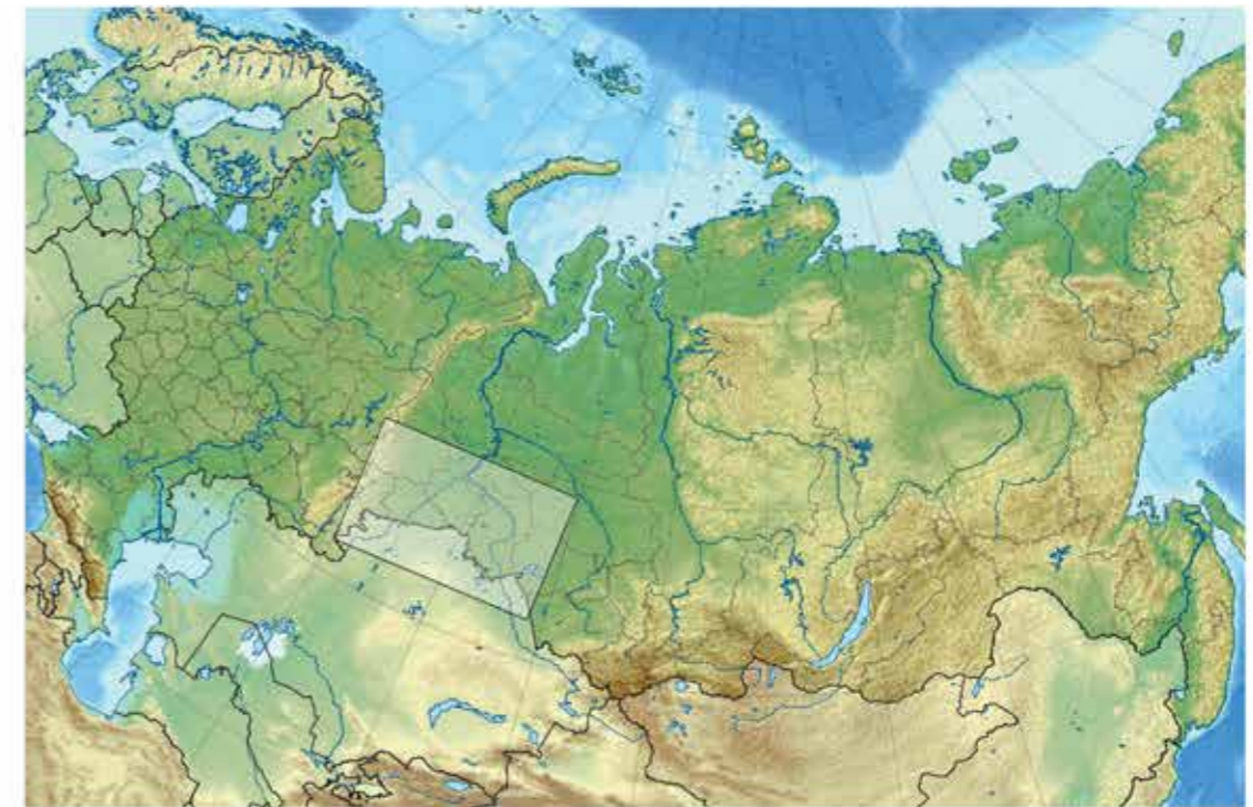
Ил. 1. Карта Северной Евразии с указанием территории расположения анализируемых памятников

Отпечатано в ОАО «ИПП «Уральский рабочий» 620990, Екатеринбург, ул. Тургенева, 13