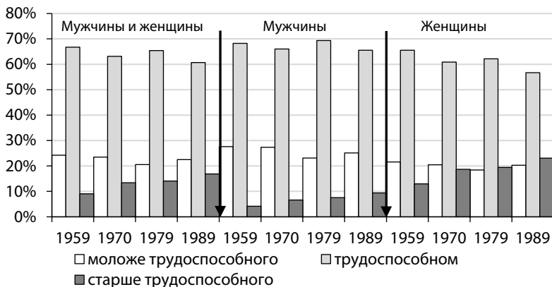
Рис. 2. Соотношение населения Свердловска в нетрудоспособном и трудоспособном возрасте, из общей численности населения г. Свердловска (сост. по: 22, с. 28)

в общей численности населения города связано, прежде всего, с сокращением общего уровня смертности, и, как следствие, увеличением средней продолжительности жизни жителей. Если лица старше 60 лет в 1959 г. составляли 6,5 % общего числа жителей города, а в 1970 г. — 10,1 %, то в 1989 г. их удельный вес достиг 13,9 %.