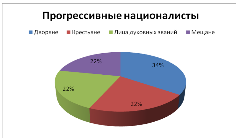
Рис. 3. Сословная принадлежность депутатов