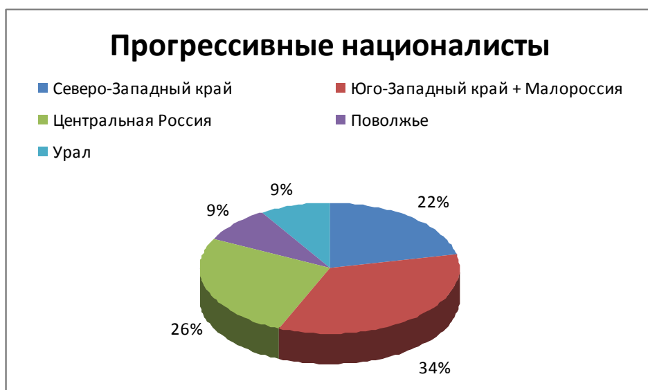
Рис. 2. Территориальная принадлежность депутатов