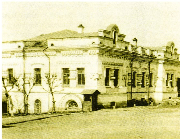
Дом Ипатьева в Екатеринбурге – последнее достоверно известное пристанище императорской семьи