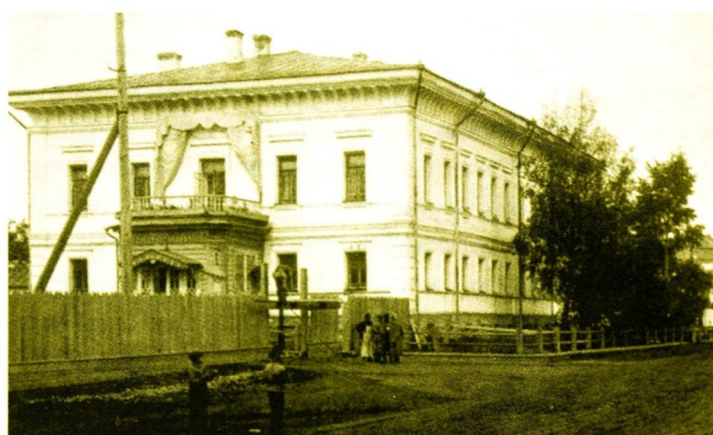
Бывший губернаторский дом в Тобольске. Здесь царская семья содержалась под арестом с августа 1917 года по апрель 1918 года.

Через неделю после ратификации Брестского мира, 1 апреля 1918 года, состоялось постановление Президиума ВЦИК, которое предусматривало уси-