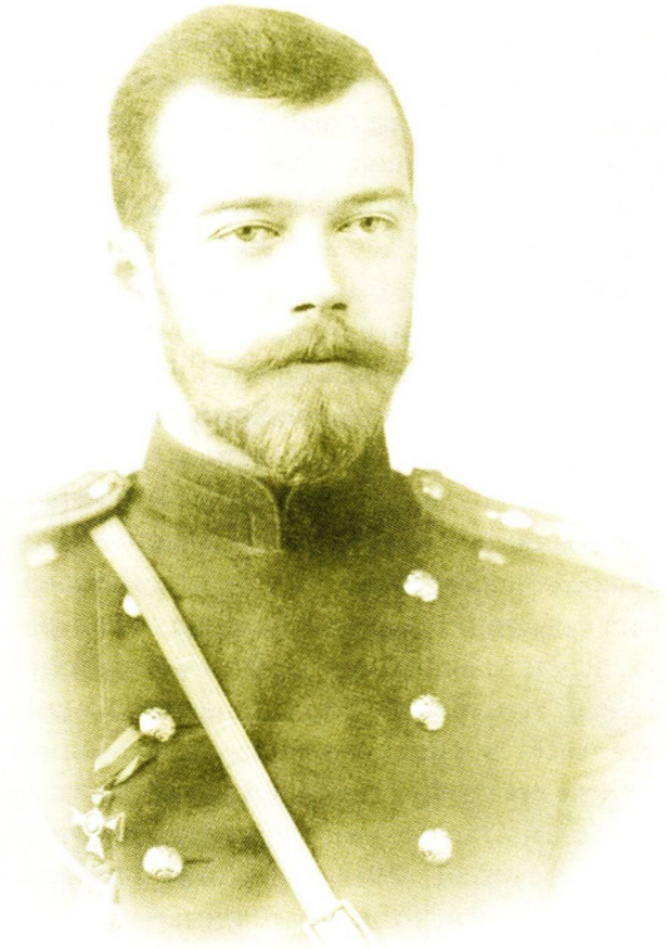
Цесаревич Николай. 1894 год

Теперь о прижизненных медицинских показателях. Остановимся на черепе №4, приписываемом Николаю II. В представлении прокурору Казанской судебной палаты от 26 ноября 1918 года сообщалось, что «по заявлению доктора Деревенько (врача